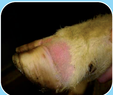
Caora a bhfuil an galar gormtheanga uirthi a bhfuil an fáinne corónach athlasta.