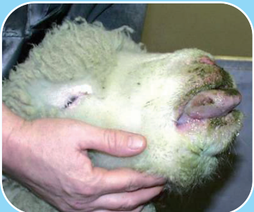
Caora a bhfuil an galar gormtheanga uirthi le sileadh raidhsiúil sróine agus le haghaidh ata.