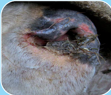
Bó a bhfuil an galar gormtheanga uirthi le creimeadh mhúcós na sróine.