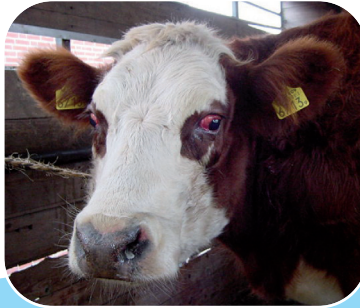
Bó a bhfuil an galar gormtheanga uirthi le toinníteas agus sileadh sróine.