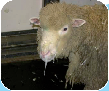
Caora a bhfuil an galar gormtheanga uirthi le sileadh raidhsiúil sróine agus le haghaidh ata.

Chun tuilleadh eolais a fháil, lena n-áirítear grianghraif sa bhreis ar roinnt de chomharthaí cliniciúla an ghalair, féach an leathanach maidir leis an ngalar gormtheanga sa rannóg um Shláinte agus Leas Ainmhithe ar láithreán gréasáin na Roinne ag www.agriculture.gov.ie .