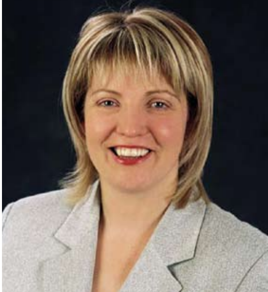
Máire Ní Chochláin, T.D., Aire Talmhaíochta agus Bia

Is breá liom an Tuarascáil Bhliantúil seo, a chlúdaíonn mo chéad bhliain iomlán mar Aire Talmhaíochta agus Bia, a chur os bhur gcomhair.