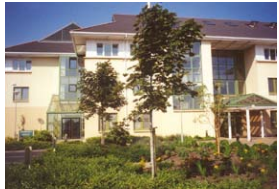
Oifig Phort Laoise

Cuireadh pleananna forfheidhmithe sonracha do Mhainistir Fhear Maí agus do Mhaigh Chromtha i dtoll a chéile.