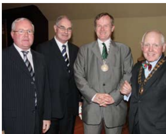
Aire Stáit, Breandán Mac Gabhann T.D., agus Comhdháil Idirnáisiúnta ar Bheachaireacht á hoscailt aige, Lúnasa 2005.

Tionóladh laethanta oscailte do Chumann na Soláthróirí Arbhair Indiaigh agus do Chumann Trádála Siolta na hÉireann, san Ionad Náisiúnta Tástála Cineálacha Barr, Bacastú, Co, Chill Dara agus i bhFeirm Bhaile Doire Abhann, Mainistir Fhearmaí, Co. Chorcaí i rith na bliana. Rinne feirm na Roinne ag The Tops, Ráth Bhoth, agus an Áis Tástáil Chineálacha Barraí ag Coláiste Chill an Daltúnaigh óstaíocht ar ghrúpa ar spéis leo na trialacha éagsúla atá ar bun iontu.