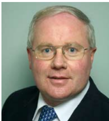
Brendán Mac Gabhann, T.D.,

Tar éis teacht an chineáil H5N1 den fhliú éan isteach san Eoraip i 2005, thug mo roinnse sraith de bhearta isteach chun a chinntiú go ndéanfaí cás ar bith den ghalair in éin fhiáine a aimsiú go luath, an baol go gcuirfí an galar ar aghaidh go dtí an ealta thráchtála éanlaithe clóis a íoslaghdú, agus dá dtarlódh a leithéid de tharchur go ndéanfaí an ráig a bhainistiú go críochnúil. Chuir an cur chuige seo béim ar leith ar ardleibhéal forairdill agus ar fhaire mhéadaithe. Cuid lárnach de chur chuige na Roinne ab ea bunú an chlár d'úinéirí ealta éanlaithe