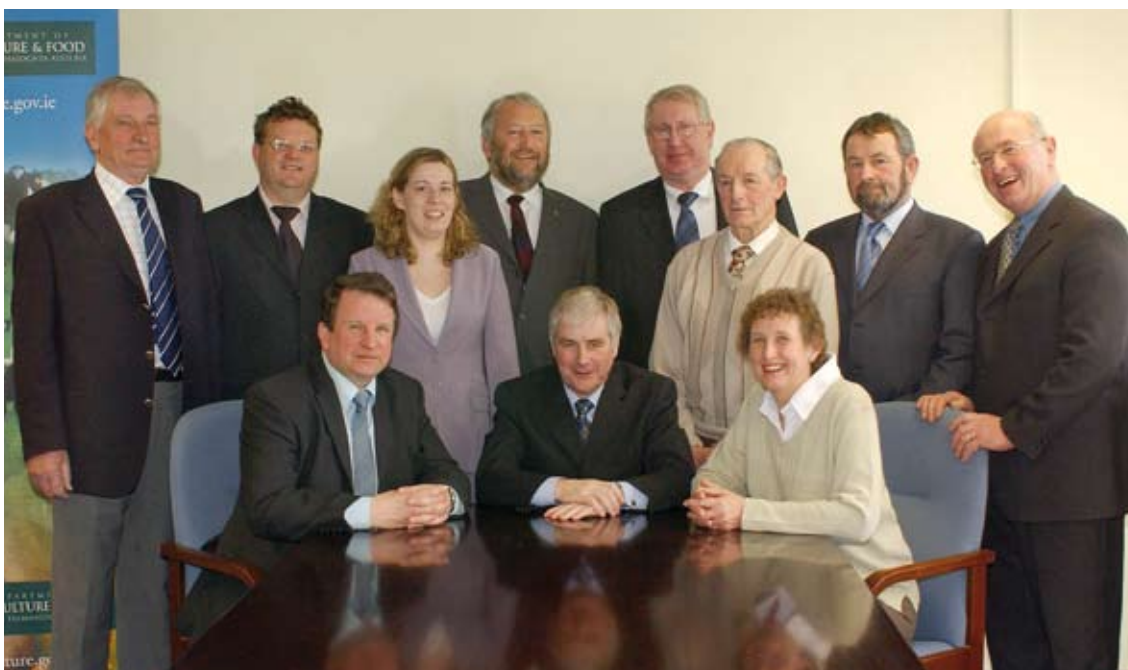
Aire Stáit Seán de Brún TD ag fógart leaiochtaí Prímhe Foraoiseachta 2005, Aibreán 2005.

Oidhreacht agus Rialtais Áitiúil faoi. Rinne sé ionadaíocht don Roinn Talmhaíochta agus Bia i bhfórait bhithéagsúlachta a leithéid an Grúpa Stiúrtha Idir-Ranna um fhorfheidhmiú an Phlean Bhithéagsúlachta Náisiúnta agus san Ardán Náisiúnta le haghaidh Taighde Bithéagsúlachta. Bhí páirt aige freisin sa Tríú Tuarascáil Náisiúnta de chuid na Náisiún Aontaithe faoin gComhdháil um Bithéagsúlacht.