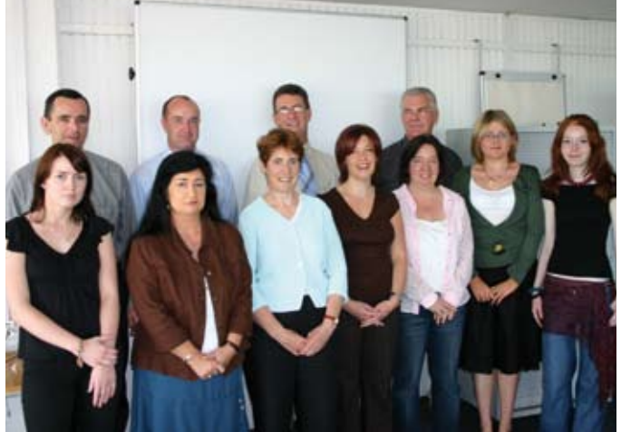
Baill fhoirne d'Aonad Oilíúna agus Forbartha na Roinne.

I 2005 rinne an Grúpa Fíorú Feidhmiúchán Státseirbhíse (GFFSS) athbhreithniú ar bhonn leanúnach ar an dul chun cinn a bhí déanta ag an Roinn ar an gclár oibre nuachóirithe. Glacadh i Samhain 2004 le Plean Gnímh athbhreithnithe ag leagan amach coimítmintí breise do 2005 agus 2006. Is tríd an gCoiste Páirtíochta a cuireadh isteach Tuarascálacha Cuimsitheacha ar Dhul chun Cinn i Márta agus i Meán Fómhair 2005 ag léiriú an dul chun cinn a bhí déanta ar shaincheisteanna a leithéid seirbhís chustaiméara, úsáid éifeachtach acmhainní, nuachóiriú agus solúbthacht, dlárú agus bainistíocht rialaitheach feabhsaithe AD agus ICT. Cuireadh ar fáil ábhar breise freisin i ndáil le cur i ngníomh Táscairí Tábhachtacha feidhmíochta i Ráiteas Straitéise dár gcuid féin 2005-2007. Rinneadh dul chun cinn sna réimsí riachtanacha agus rinne an GFFSS cinneadh fabhrach.