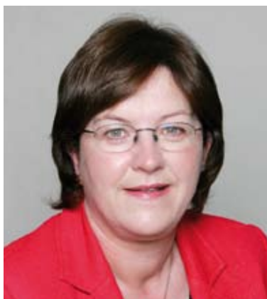
Máire de Bhailís T.D.,

Aire Stáit a ghlac áit Sheáin de Brún T.D, Aire Stáit ar 14 Feabhra 2006.