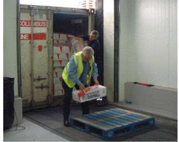
Allmhairithe á seiceáil ag Post Cigireachta Custaim Chalafort Bhaile Átha Cliath

Ní foláir deimhniú sláinte a bheith ag táirgí ainmhithe atá ag teacht isteach san AE agus iad a bheith faighte ó thíortha agus ó fhorais atá faofa agus a bhfuil smachta táirgíochta agus próiseála acu atá comhionann le cinn an AE. Má fhaightear nach bhfuil lasta géilliúil do na coinníollacha sláinte ainmhithe agus pobail déantar é a ghabháil lena athonnmhairiú chuig a thír thionscnaimh nó lena scrios. Faoi reachtaíocht an AE agus reachtaíocht náisiúnta tá iallach ar allmhairí táille a íoc ar son chostas cigireacht tréidliachta.