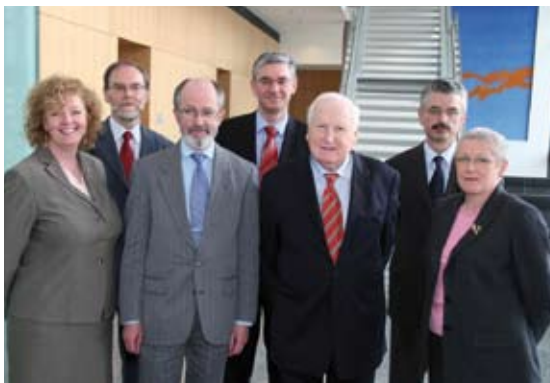
Baill de Choiste Iniúcháireachta na Roinne.

Chríochnaigh an tAonad Iniúchta Inmheánaigh méid substainteach obair iniúchta i rith na bliana 2005. Folaíonn sin cur i bhfeidhm cláir iniúchta inmheánaigh agus cláir mionscrúdú iniúchta. Chríochnaíodh agus eisíodh ceithre thuarisc inmheánacha déag agus daichead a seacht dtuarisc iniúchta i rith na bliana. Tugadh chun críche na ceanglais rialaitheacha uile maidir le iniúchadh agus le rialúchán i gcomhréir leis na hamscálanna forordaithe mar atá siad leagtha amach i Rialachán Chiste Struchtúraigh agus Mhionscrúdaithe an AE. Chríochnaigh an grúpa iniúchta TE le cúnaimh ó chomhairleoirí seachtracha speisialtóra méid cuimsitheach de thuariscí iniúchta. Cuireadh clár cuimsitheach oiliúna ar bun in athuair faoinar cuireadh 172 lá oiliúna ar fáil do bhaill foirne an Aonaid.